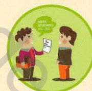
Agglomération lyonnaise Face-à-face