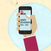
Enquête par téléphone pour le reste du périmètre