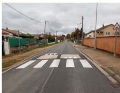
Route de Tramoyes

Nathalie GUILLERMIN , policière municipale nous a rejoins le 24 août 2020.